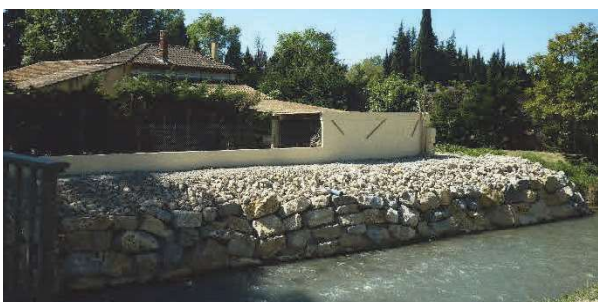
Confortement de berges à Saint Etienne du Grès