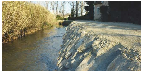
Confortement de berge à Saint Rémy de Provence