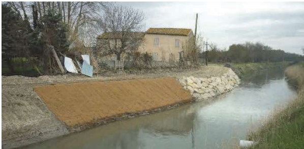
Confortement de berge à Saint Etienne du Grès