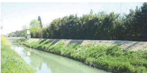
Nivellement de berge à Tarascon