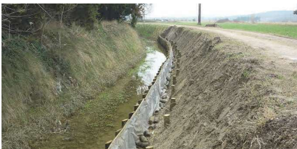
Confortement de berge à Tarascon