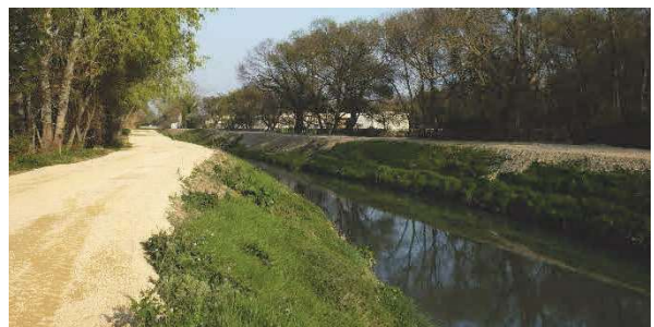
Nivellement de berges à Saint Etienne du Grès