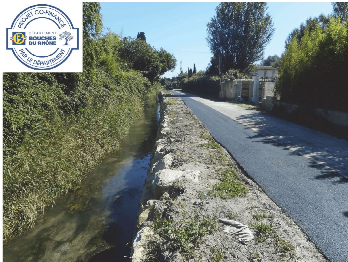
Travaux achevés le 23/07/2020

Le montant total de cette opération s'élève à 83 200,00 € H.T financée à 40% par le Département des Bouches du Rhône, 20% par la Région Provence-Alpes-Côte d'Azur, et 40% par la commune de Graveson.