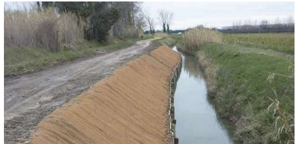
Confortement de berge à Tarascon