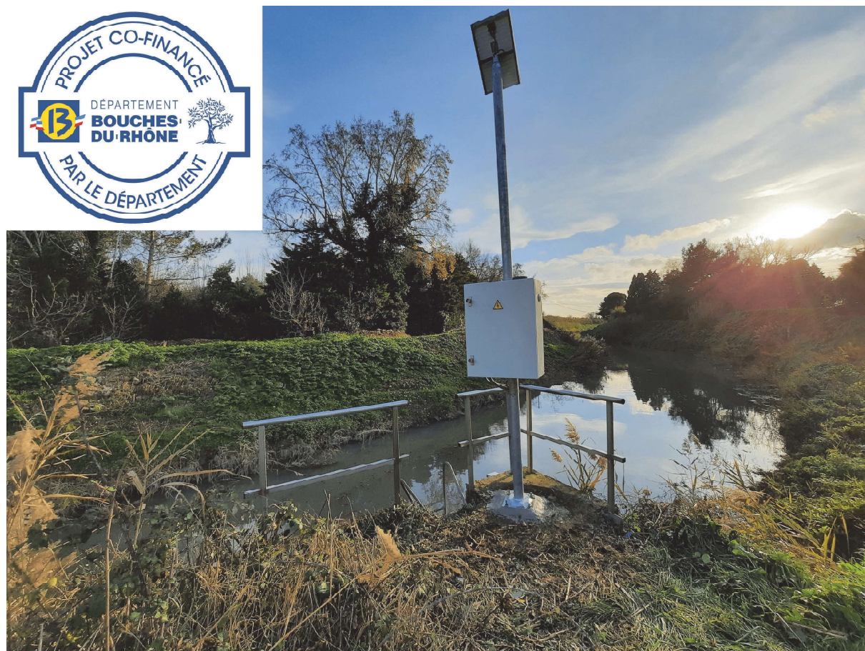
Travaux achevés le 16/12/2020

Le montant total de cette opération s'élève à 10 160,00 € H.T financée à 40% par le Département des Bouches du Rhône, 30% par la Région Provence-Alpes-Côte d'Azur, et 30% par la commune de Tarascon.