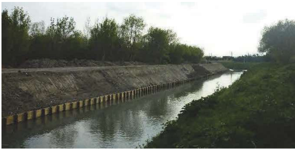
Confortement de berge à Saint Etienne du Grès