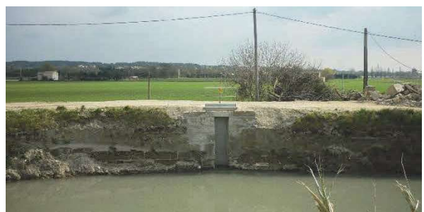
Remplacement d'une vanne « martelière » à Fontvieille