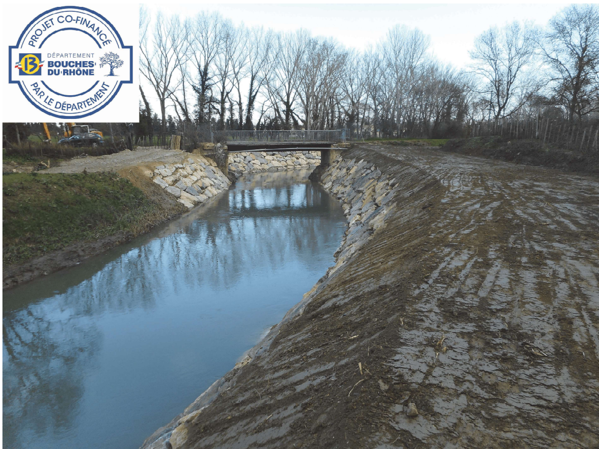
Travaux achevés le 28/01/2020

Le montant total de cette opération s'élève à 112 078,50 € H.T financée à 40% par le Département des Bouches du Rhône, 20% par la Région Provence-Alpes-Côte d'Azur, et 40% par la commune de Saint Etienne du Grès.