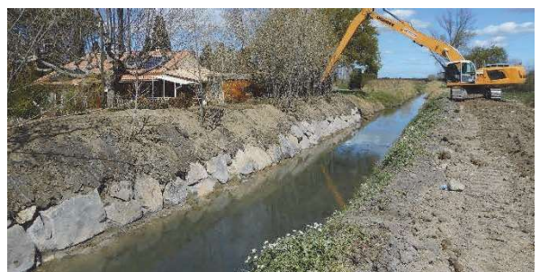
Confortement de berge à Maillane