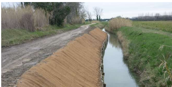
Confortement de berge à Tarascon