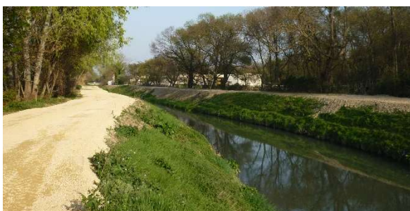
Nivellement de berges à Saint Etienne du Grès