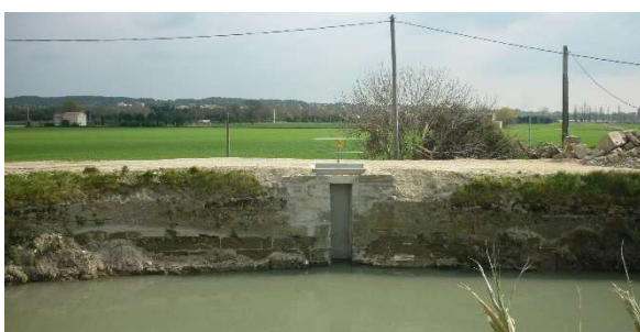
Remplacement d'une vanne « martelière » à Fontvieille