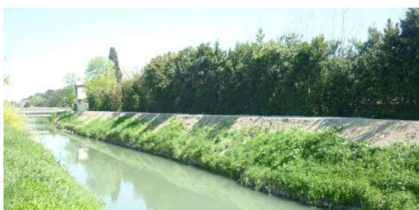
Nivellement de berge à Tarascon