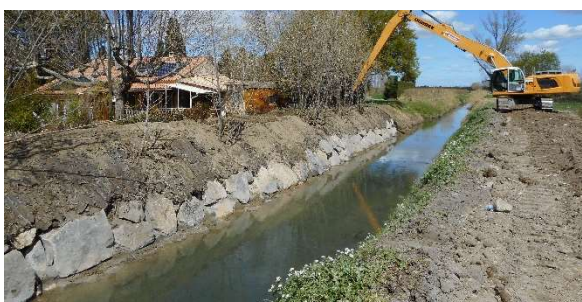
Confortement de berge à Maillane