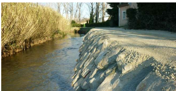
Confortement de berge à Saint Rémy de Provence