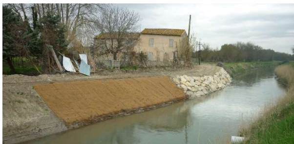
Confortement de berge à Saint Etienne du Grès