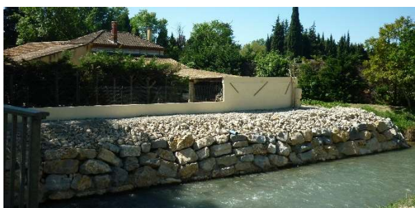
Confortement de berges à Saint Etienne du Grès