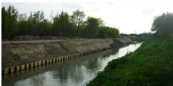
Confortement de berge à Saint Etienne du Grès