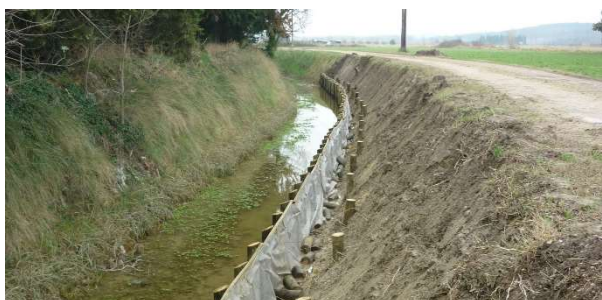
Confortement de berge à Tarascon