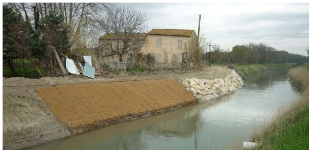
Confortement de berge à Saint Etienne du Grès