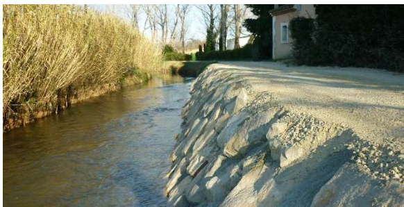
Confortement de berge à Saint Rémy de Provence