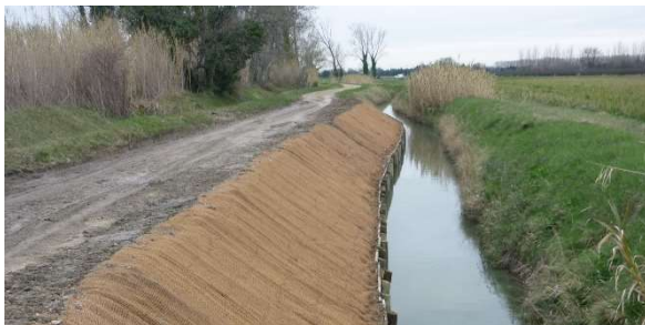
Confortement de berge à Tarascon